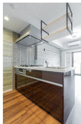
キッチン上部にオープン棚を用いた住戸