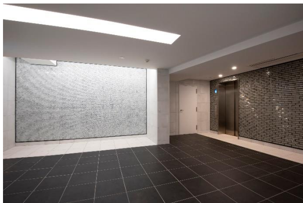
高級感を演出するエントランス