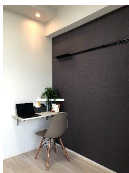
折り畳みテーブルとコーナー棚

※3 対応するネットショップで買い物をした際に、受取方法を「置き配」と指定すると、不在時でも配達員が集合玄関のオートロックを一時的に解錠し、玄関前などの指定された場所まで荷物が届くシステム