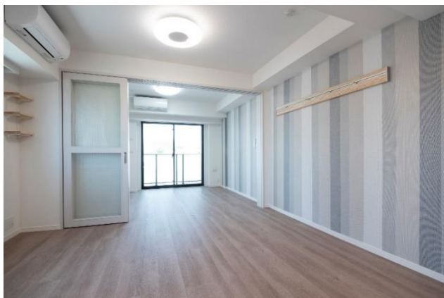
「飾らない自然な暮らし」をイメージした アクセントクロスを用いた住戸

6階と8階のコンセプトルーム(6戸)では、「飾らない自然な暮らし(ナチュラル style)」や「映画の中のような暮らし(シネマ style)」「ハワイの青い海(ハワイアン style)」など、それぞれにコンセプトを持たせたアクセントクロスや建具を採用しました。2LDKのリビング・ダイニングには、キッチン上部にオープン棚やスポットライトを導入するなど空間に立体感を持たせ、洗練されたデザインを取り入れています。