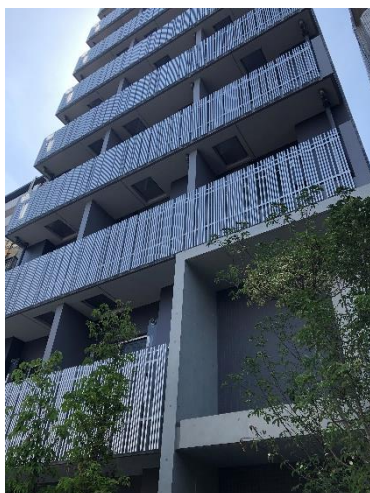
「ベルファース戸越」外観

外観は、シックなチャコールグレーの外壁と、バルコニーの手すりに採用したマットなアルミの堅格子のコントラストで垂直方向の流れを強調するデザインとしています。エントランスは、2層吹き抜けの縦方向の広がりを感じる開放感のある空間にしています。