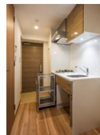
移動式キッチン収納 （ベルファース門前仲町Ⅱ）