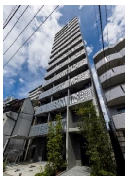
「ベルファース戸越」外観

「ベルファース恵比寿ビジュ」は、JR 山手線「恵比寿」駅から徒歩14分、東京メトロ日比谷線「広尾」駅、都営三田線「白金台」駅など、3駅・5路線の利用が可能です。恵比寿は、「住みたい街ランキング」※1でも、毎年5位以内にランキングする街で、本物件は、都心でありながら「国立科学博物館附属自然教育園」などの緑豊かなエリアに位置します。