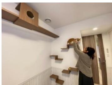
キャットウォーク・ステップ （ベルファース馬込）