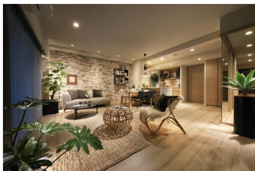
リビングダイニング (モデルルーム)