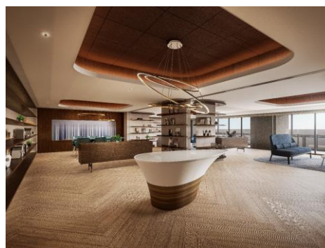
オーナーズラウンジ（イメージ）

本物件は、2022年3月1日（火）に着工 ※1 し、当社の分譲マンション、サーパスシリーズにおいて過去最大規模の開発です。JR上越新幹線・信越本線・白新線・越後線が乗り入れる「新潟」駅より徒歩10分、数多くの大型商業施設が集まる新潟の中心エリア「万代シティ」内に位置します。