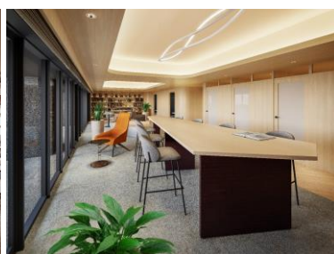
オーナーズライブラリー (イメージ)