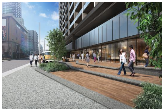
シティデッキ (イメージ)