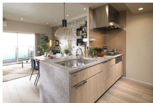
キッチン (モデルルーム)