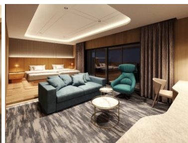
ラグジュアリーキャビン (イメージ)