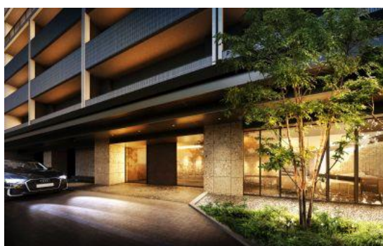
エントランス（イメージ）

本物件は、富山地方鉄道市内電車「西町」電停から徒歩4分、にぎわいにあふれた富山駅南の「総曲輪エリア」に位置します。「総曲輪フェリオ」「SOGAWA BASE」などの商業施設や商店街などが徒歩10分圏内に集まるほか、市の再開発計画「中心市街地基本計画」のもと、路面電車など回遊性のさらなる強化やにぎわい創出などが、今後も期待されるエリアです。