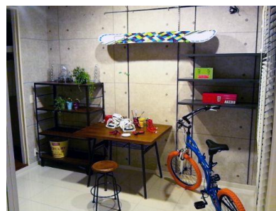
フェスタトリエ（イメージ）

玄関からつながる土間エリア（フェスタトリエ）は、趣味のものの収納や、DIYスペースに利用するなどライフスタイルに合わせて活用できるスペースです。