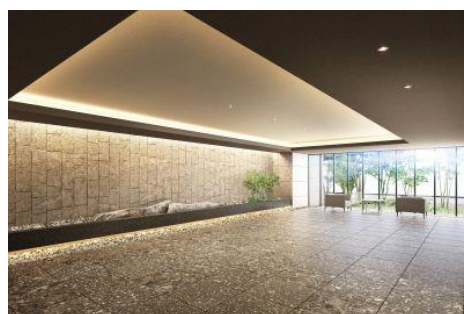
エントランスホール（イメージ）

駐車場は、住戸100%の設置率です。ご自宅や外出先からお手持ちのスマートフォンで、敷地内立体駐車場の出庫予約ができるアプリをご用意しています。天候が悪い日でも少ない待ち時間でスムーズに車をご利用いただけます。エントランス前の車付けスペースには、待機用のベンチ、エントランス内には荷物仮置きボックスなどをご用意します。ボックスは施錠ができるため、手荷物を安全に一時保管できます。