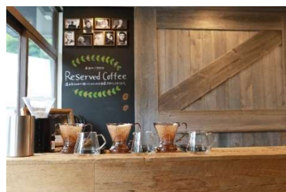
「宮の森アルケミストコーヒー」店内