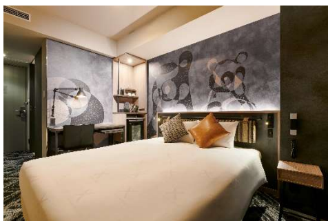
プレミアールーム

ホテル公式ウェブサイト https://www.crosshotel.com/sapporo/