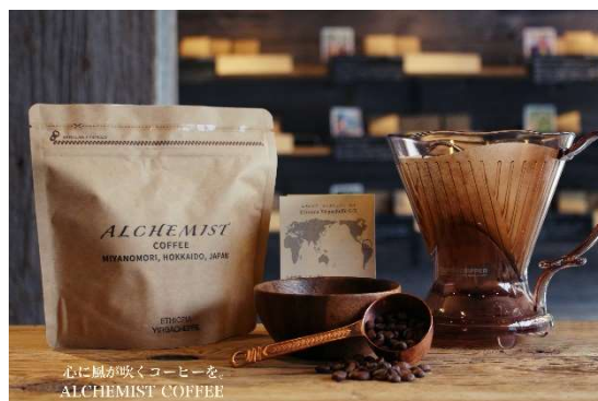
「宮の森アルケミストコーヒー」（イメージ）

クロスケーションは、2021年に販売開始した「地域の魅力を体験できるホテル時間」と「ホテル周辺での街歩き」をご提案する宿泊プランです。今回は「クロスケーション BIZ」として、テレワークやワーケーション、出張など多様化するワークスタイルに適應できるよう企画しました。