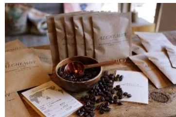
「宮の森アルケミストコーヒー」 イメージ

多様化するワークスタイルにあわせて、お客さまにとってホテルでの滞在が“地域を感じる豊かな時間”となるように街のスペシャリスト「宮の森アルケミストコーヒー」とタイアップをしました。ホテルのお部屋で楽しんでほしいコーヒー4種類と、同店がおすすめするコーヒードリッパー、コーヒーミルを客室にご用意します。希望者にはフレンチプレスと水出しコーヒー用ボトルを貸し出ししますので、さまざまな飲み方を体験していただけます。