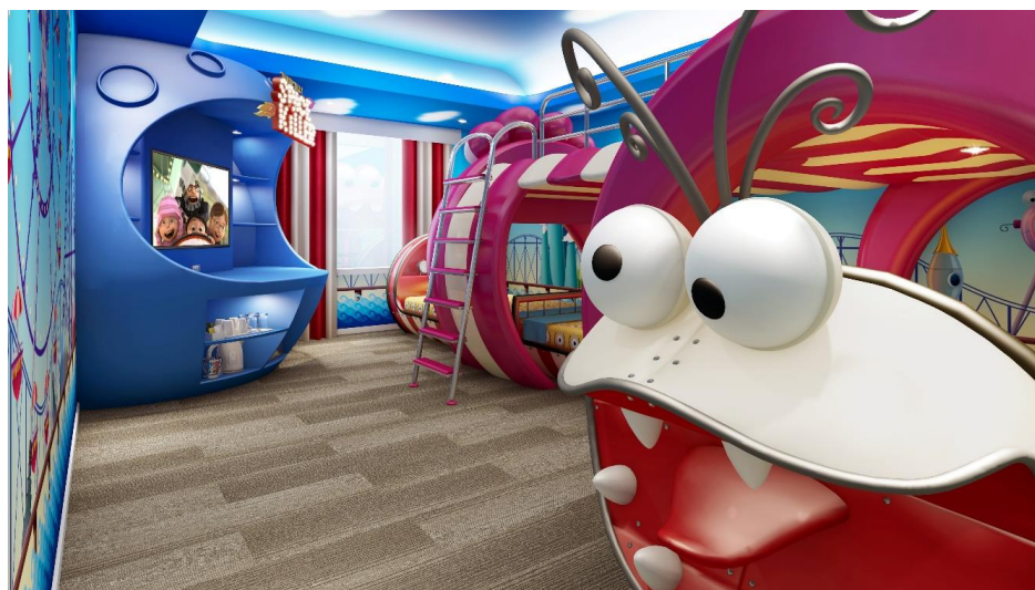
「ミニオンルーム3～思い出の遊園地『スーパー・シリー・ファンランド』～」イメージ

ユニバーサル・スタジオ・ジャパン・オフィシャルホテル「ホテルユニバーサルポート」(所在地:大阪市此花区、総支配人:金井 紀生)に、2022年7月15日(金)、イルミネーションの大ヒットを記録したアニメ映画『怪盗グルーの月泥棒』に登場する“遊園地”をモチーフとした「ミニオンルーム3～思い出の遊園地『スーパー・シリー・ファンランド』～」が誕生しますので、お知らせします。