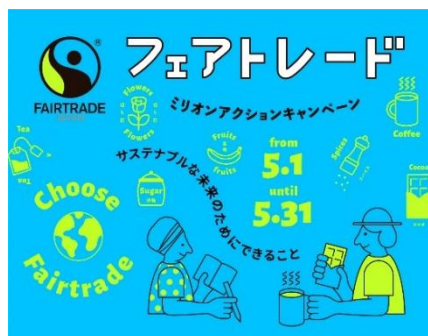
フェアトレード ミリオンアクションキャンペーン 2022