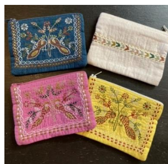
フェアトレード商品（イメージ）

今回の企画は、SDGsの取り組みを推進するとともに、フェアトレードに親しみをもってもらう機会を作ることを目的としています。販売商品は、生産者や地域社会の発展にもつながるようフェアな価格・条件で取引された「東ティモールマウベシ珈琲」などの食料品から、インドの民族衣装「サリー」の端切れから作ったポーチなどの日用雑貨まで、さまざまなアイテムをご用意します。