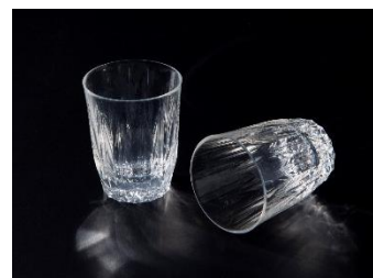
KINJO JAPAN E1