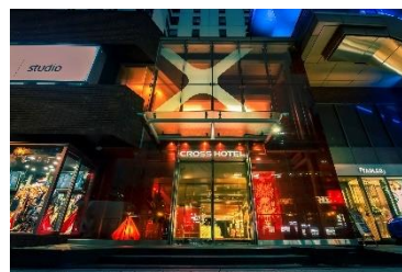
クロスホテル大阪

「この街、このホテルで過ごすかけがえのないひととき」をコンセプトに、大阪ならではの体験と、ホテルでの「今」を大切にし、ご滞在中に過ごすすべての時間を、他の街や他のホテルでは出会えない、かけがえのない時間へと高める、この街の良さを常に探求したサービスを提案するホテルです。また、なんばの中心地にある立地を生かし食やアート・音楽などを通して、地域文化や歴史の古さと新しさの融合を表現する活動を推進しています。多くの旅行者がこの場所で交流し、文化への理解が深まることで、地域活性化につながるよう、賑わい創出に貢献してまいります。