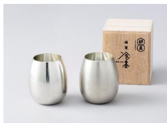
錫製タンブラー 冷香-reico- 磨・白上