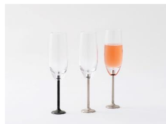
DOKURO エンジンバルブ シャンパングラス flauto