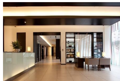
クロス・ウェーブ梅田 1階ロビー