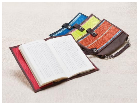
ハンドルブックカバー らうらうじ second hose

本イベントでは、大阪製ブランド認定制度※1に基づき大阪府知事が認定した「大阪製ブランド製品」を期間限定で館内に展示します。地元「大阪」にある中小企業の製品を身近に感じていただき、大阪の企業の技術力、製品に込められた思いや価値をお伝えします。