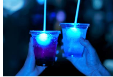
幻想的な館内にぴったりのソーダ

昨年の「夜のすいぞくかん」でも販売した、ソーダの中にクラゲの形の光るキューブを浮かべたドリンクが復活します。爽やかな見た目も綺麗なブルー（ブルーハワイ味）と、色鮮やかなレッド（カシス味）の 2 種類をご用意します。光るクラゲのキューブは、お土産としてお持ち帰りいただけます。