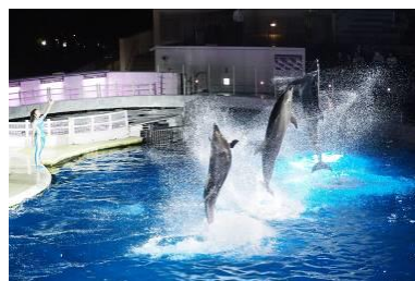
夜限定のイルカパフォーマンス

日中に開催しているイルカパフォーマンス「YEAH!!」を夜限定の照明で演出します。色とりどりのムービングライトやスポットライトなどの光のなか、音楽に合わせて一緒に手拍子をしたり、イルカがジャンプする姿をお楽しみいただけます。公園の暗闇を背景にスタジアムでイルカが浮かび上がる夜ならではのパフォーマンスです。