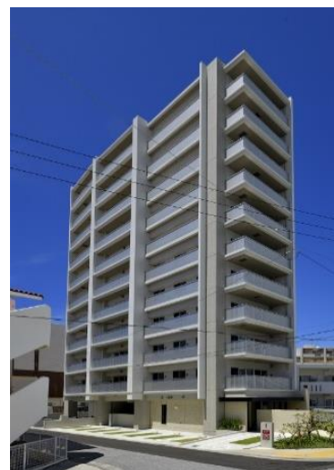
ライオンズ宜野湾 グランテラス

宜野湾港マリーナまで徒歩12分、生活利便性を備えたエリアに位置し、日常生活の中で沖縄西海岸の魅力を感じています。三面接道の開放的な地形を生かし、全区画平地式駐車場を設えたほか開放的な住空間も実現しています。