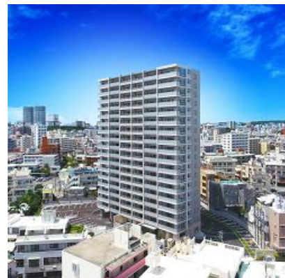
ライオンズ那覇三原 マスターズゲート

ゆいレールで「那覇空港」駅まで18分、那覇市のメインストリート「国際通り」から徒歩圏内と、生活利便施設が充実しながらレジャーも満喫できる環境です。建物は全戸南西向きの地上18階建て、エントランスには琉球石灰岩を採用し、上質な空間に仕上げました。