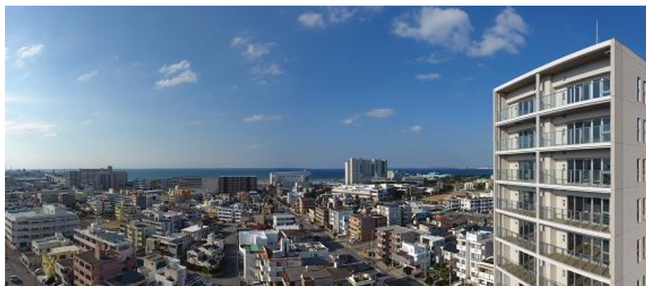
外観(右建物)と周辺の風景