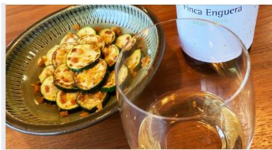
北海道の季節の野菜料理とワイン