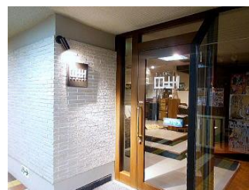
画廊を兼ねたビストロ