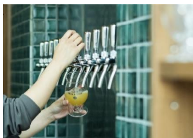
北海道産のホップを使用した クラフトビール

予 約：ホテル公式ウェブサイト ( https://www.crosshotel.com/sapporo/ )