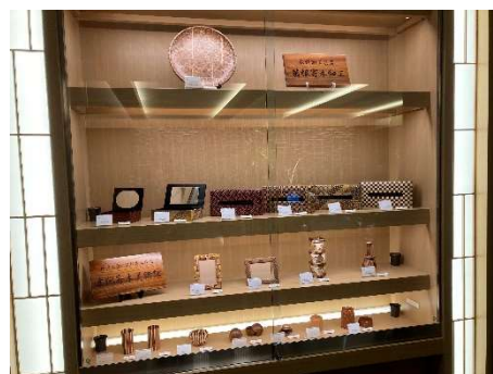
箱根・強羅 佳ら久 ギャラリー

本企画は、箱根の伝統工芸「箱根寄木細工」の魅力をたくさんの方に知っていただきたいとの思いから企画しました。