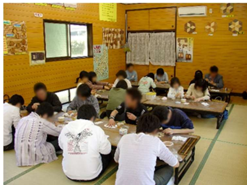
本間寄木美術館 体験教室（イメージ）