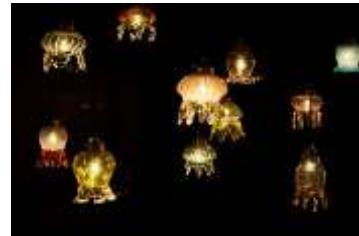
くらげとあかりたち（イメージ）