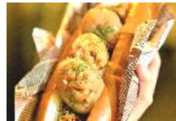
びっクラゲ！チリドッグ

パンの間からクラゲが飛び出たような見た目がインパクト大のチリドッグです。ソーセージの代わりに、クラゲ形の味付けこんにゃくを挟み、チリソースをトッピングしました。優しい甘さのパンと、スパイシーなソース、和風味のクラゲこんにゃくが、意外にマッチする味と食感をお楽しみください。