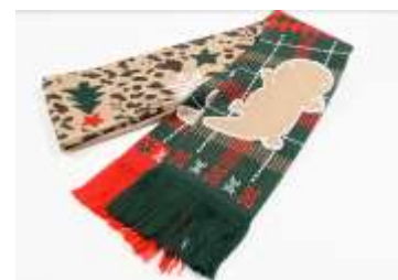
オオサンショウウオ柄のマフラー

オンラインショップ： https://store.shopping.yahoo.co.jp/kyoto-aquarium/