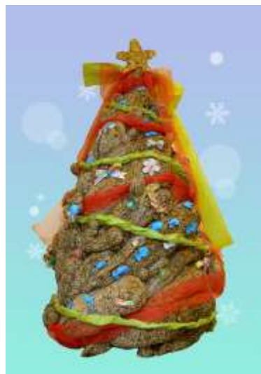
約2mのオオサンショウウオツリー

2013年より展示し、京都水族館の冬の風物詩にもなっている「オオサンショウウオクリスマスツリー」です。今年は「リサイクル」をテーマに、イベントなどで使用し、保管されていた大小さまざまなオオサンショウウオぬいぐるみ約70個を積み上げツリーの形にしました。装飾には古くなった飼育スタッフのウェットスーツをアレンジし、魚型やクラゲ型のオーナメントを作成しました。そのほか、廃棄予定だった飼育スタッフの長靴や水槽の水を循環するためのポンプに設置していた圧力計なども使用しています。アイデアから制作まで、スタッフのみで作り上げた高さ約2mのクリスマスツリーをお楽しみください。