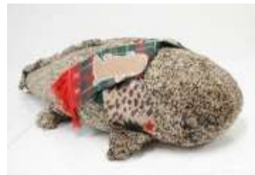
マフラー付きオオサンショウウオぬいぐるみ