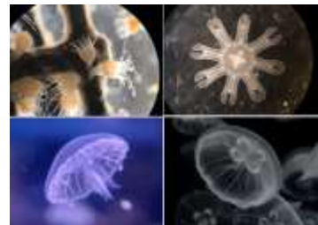
ミズクラゲの成長過程（イメージ）

クラゲは一般的に、ポリプと呼ばれるイソギンチャクのような状態から、形を変えながら成体になります。種類ごとに成長速度や過程は異なり、そうしたクラゲの不思議な姿をマクロレンズで撮影した貴重な記録映像と解説を合わせて、約 150 インチの大型モニターで展示します。成体へ近づいていく過程を追うことで、新たな発見とクラゲの魅力に近づきます。