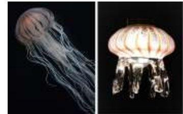
アカクラゲとランプシェード