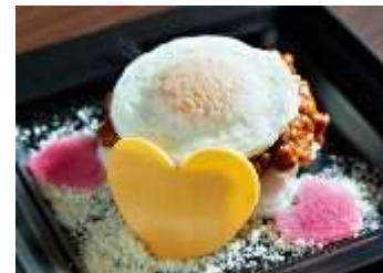
ハートのキーマカレー

おせち料理が続いたお正月明けなどにぴったりなスパイシーカレーが登場します。ハート形にくり抜いた鮮やかな紅色の紅芯大根とチーズをトッピングし、上に目玉焼きを乗せたボリューム満点のキーマカレーです。寒い時期に嬉しい、温かくスパイシーな味をお楽しみください。