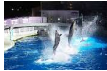
夜のイルカパフォーマンス

さらに、12月24日（金）～26日（日）の3日間は、営業時間を20時まで延長し、夜のイルカパフォーマンスを実施します。夜限定の照明で演出し、キラキラと輝く水面から飛び出すイルカたちのダイナミックなジャンプや、水しぶきなど、冬空の下で幻想的なパフォーマンスをお楽しみいただけます。