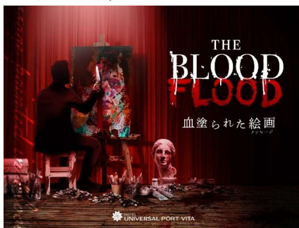
「THE BLOOD FLOOD 血塗られた絵画 (メッセージ)」イメージ

ユニバーサル・スタジオ・ジャパン オフィシャルホテル「ホテル ユニバーサル ポート ヴィータ」(所在地：大阪市此花区、総支配人：金井 紀生)は、2021年10月15日(金)～2022年2月27日(日)の期間、1日1室限定の謎解きホラールーム「THE BLOOD FLOOD 血塗られた絵画」の宿泊プランを販売しますのでお知らせします。2021年9月21日(火)より、予約受付を開始します。