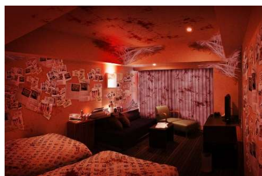
ホテル ユニバーサル ポートにて昨年実施の 謎解きホラールーム「THE JOURNALIST ～写真が明かす記憶（かぎ）～」