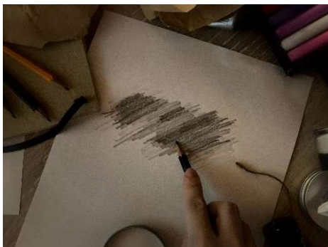
絵画技法のフロッタージュを用いて謎を解く (イメージ)

まるで血塗られたような不気味なアトリエに様変わりした客室には、絵画、画材、美術品などが散在しています。その中からストーリーの謎を解くための手がかりを見つけ、美術学者になりきり調査することが真相発見の近道です。数多くの美術品をどう調べるか…ご自身のスマートフォンを使ってストーリーを進めながら、絵画をよく見て調べたり、絵画技法のフロッタージュ（物の上を鉛筆などでこすって模様などを写し取る技法）を使うなど、デジタルとアナログのツールを駆使していただきます。客室内に謎解きミッションを多数用意していますので、クリアするごとに真相に近づきます。