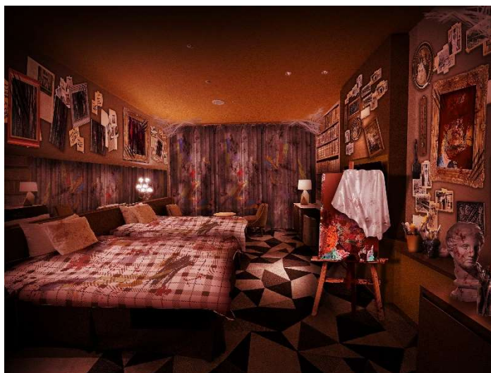
「THE BLOOD FLOOD 血塗られた絵画（メッセージ）」客室イメージ

ある日、医療センターの竣工記念に寄贈された絵画に美術学者は目を奪われる。突如心は暗闇へ誘われながら不可思議な恐怖心に襲われていく。美術学者は、絵画が秘める幾つもの謎を解き明かし、得体の知れない恐怖感から脱却しようと調査に挑む。このアトリエで誰が、何のために…。真実は一つのはずなのに、謎を解くごとに謎は深まるばかり。美術学者のプライドにかけて、恐怖体験に耐えながら真相を明らかにすることはできるのか。