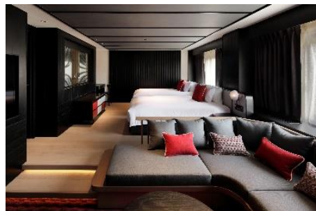
クロススイートジュニア

宮城大弥投手、山本由伸投手、吉田正尚選手の直筆サインボールや、京セラドーム大阪の指定席、Buffaloes 応援タオルなどがついた「ガッチリMAX！」な特別宿泊プランをご用意します。