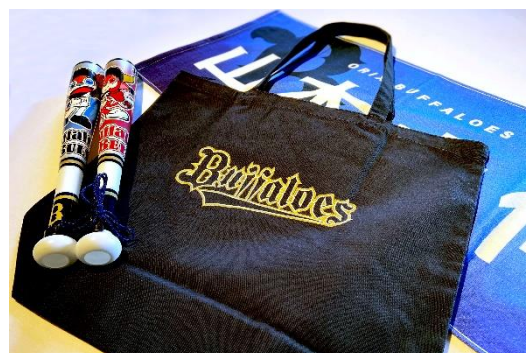
Buffaloes 応援グッズ イメージ

本企画は、2021年9月18日（土）～10月21日（木）の期間、京セラドーム大阪で開催されるオリックス・バファローズ主催19試合の開催日限定の宿泊プランです。各日1組2名さま限定で、宮城大弥投手、山本由伸投手、吉田正尚選手のうち日替わりで1名の直筆サインボール、Buffaloes 応援タオル、Buffaloes ネーム&ナンバートートバッグ、Buffaloes マスコットツインバットの応援グッズ、さらに京セラドーム大阪のバックネット裏中央エリアのビュー指定席観戦チケットがついています。試合観戦後は、当ホテルの最上階にある広々とした48㎡のスイートルーム「クロススイートジュニア」で、ワンランク上のホテルステイを満喫いただけます。