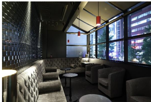
ラウンジ内ソファスペース