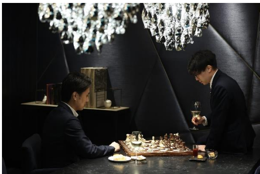
ラウンジ利用イメージ

公式ウェブサイト： https://www.crosshotel.com/osaka/