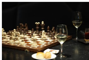
ラウンジ利用イメージ

テーブルにはコンセントタップや無料 Wi-Fi など、テレワーク環境を備えるとともに、レストランの予約、周辺観光案内などコンシェルジュサービスも利用可能です。また、ラウンジ内には大人でも楽しめるオセロやチェスといったテーブルゲームもご用意し、ホテルステイを快適に楽しくお過ごしいただけます。