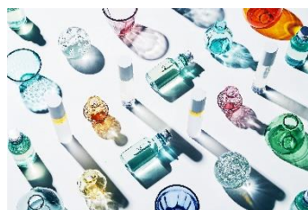
ICOR ブランドイメージ

アイヌ語で「宝物」を意味する「イコロ」から名付けられた「ICOR」は、豊富なミネラルを含み、日本の名水百選にも選ばれたニセコ羊蹄山の湧き水を使ったビューティーブランドです。2020年のブランド誕生以来、オンラインと東京近郊の一部店舗での販売のみで、北海道ではクロスホテル札幌が初の常時取り扱いとなります。