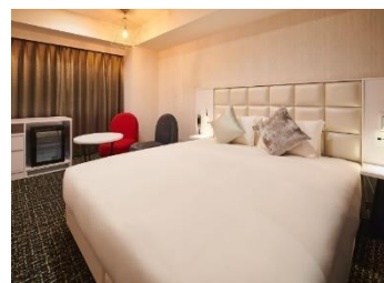
スタンダードフロア ダブルルーム