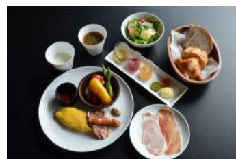
洋食朝食 (イメージ)