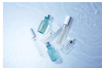
取扱商品 (イメージ)

オイルクレンジングやリキッドソープなど 3 商品、またはハンドクリームと除菌スプレーの組み合わせなどのセット商品 2 種類の計 5 つから、お一人さまにつき 1 つをチェックイン時にお選びいただけます。