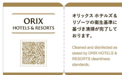
クリーンステイ・ルームシール（イメージ）

混雑回避システムを導入し、客室にしながら大浴場や朝食会場の混雑状況をご確認いただけます。