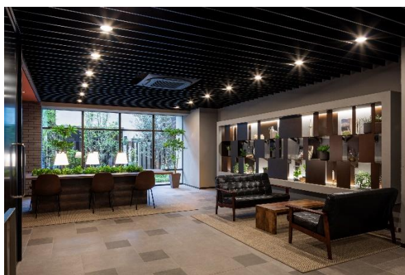
エントランスホール内の 「リモートラウンジ」（左のテーブル6席）

株式会社大京（本社：東京都渋谷区、社長：深谷 敏成）は、オリジナルブランドの賃貸マンション「ライオンズフォーシア清澄白河」（東京都江東区、13階建て、総戸数72戸）がこのたび竣工し、6月上旬より入居を開始しますのでお知らせします。