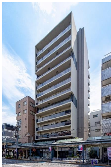
ライオンズフォーシア清澄白河 外観

ホームページ： https://www.mitsui-chintai.co.jp/resident/original/lions_forsia_kiyosumishirakawa/