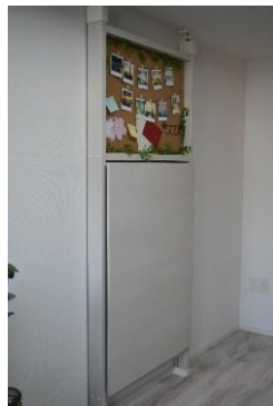
テレワークブース (左: 設置後、右: 収納後)