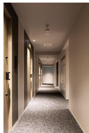
高級感のある内廊下

各住戸に繋がる廊下は内廊下設計を採用することで、セキュリティとプライバシーに配慮するとともに、安心・安全な暮らしを提供します。ホテルライクな高級感が漂います。