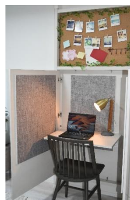
住戸内のテレワークブース

「ライオンズフォーシア清澄白河」は、東京メトロ半蔵門線・都営大江戸線「清澄白河」駅より徒歩5分、都営新宿線・都営大江戸線「森下」駅より徒歩4分と、交通利便性の高い深川エリアに位置します。地元で長年親しまれている商店街「高橋夜店通り（高橋のらくろ〜ど）」に面し、周辺にはスーパーマーケット、コンビニエンスストアも充実しています。