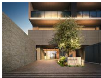
エントランスアプローチ（イメージ）

また、第一種住居地域に面していることで南西側に住宅地の穏やかな街並みが広がり、心地よく抜ける見晴らしを一望できます。