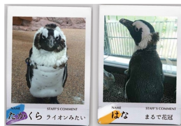
秘蔵コレクション (イメージ)

本イベントでは、当館で暮らすケープペンギンの「換羽」にフォーカスし、個性豊かな姿とあわせて、いきものの個性や生態の特徴をお伝えします。「ペンギン」エリアの壁面に飼育スタッフが撮影した今年の換羽のようすをとらえた写真を掲示するほか、これまでに公式 SNS にも投稿していない写真などを秘蔵コレクションとして公開します。また、飼育スタッフがペンギンと日々触れ合うなかで遭遇した換羽にまつわるエピソードを愛情あふれる手書きの4コマ漫画でご紹介します。