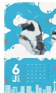
過去のオリジナルカレンダー

Instagram で当館のペンギンの換羽姿を撮影した写真を募集します。指定のハッシュタグを付けて自身のアカウントに投稿していただくと、後日、飼育スタッフの厳選な審査によって選ばれた方の写真を、京都水族館公式 LINE アカウントで毎月配布している「スマートフォン用カレンダー壁紙」のデザインの一部として採用し、館内でも展示します。