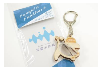
ケープペンギンの羽根キーホルダー

2017年から販売している「京都水族館オリジナル ペンギンの羽根キーホルダー」には、当館のペンギンから抜け落ちた羽を使用しています。羽根は、換羽の時期に飼育スタッフが拾い集めており、ペンギンを身近に感じるアイテムとしてとても人気の商品です。