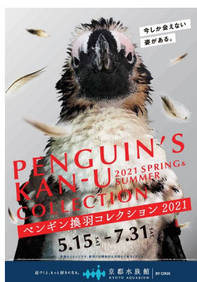
ペンギン換羽コレクション 2021 (イメージ)