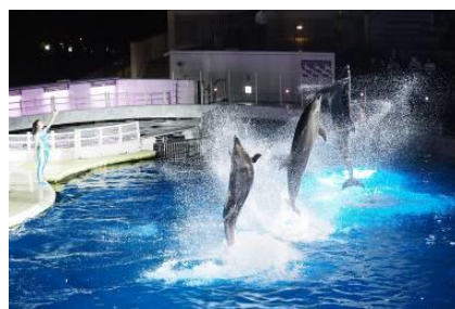
夜限定のイルカパフォーマンス

日中に開催しているイルカパフォーマンス「YEAH!!」を夜限定の照明で演出します。色とりどりのムービングライトやスポットライトなどの光の中、音楽に合わせて一緒に手拍子をしたり、イルカがジャンプする姿をご覧ください。公園の暗闇を背景にイルカが浮かび上がる夜ならではのパフォーマンスです。