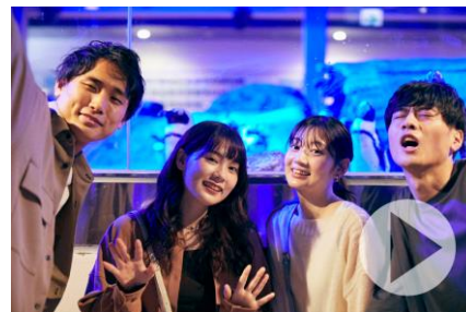
オリジナルムービー（イメージ）

開催に合わせて、オリジナルムービーを京都水族館公式 Youtube チャンネルや SNS で公開します。男女4人が実際に「夜のすいぞくかん」を楽しむようすを再現したストーリー仕立ての映像です。過ごし方の参考としてもご覧いただけます。