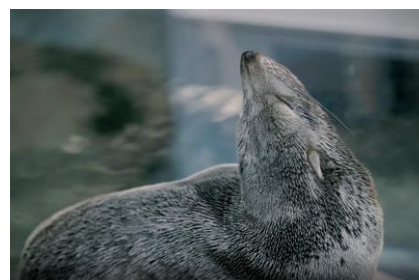
すやすやと眠るオットセイ

「イルカスタジアム」「京の海」「ペンギン」のエリアを中心に、夜限定の照明で幻想的な空間を演出します。いきものが寝ている姿や、ゆったりと魚が泳ぐようすを眺めたり、特別なひとときをお過ごしください。