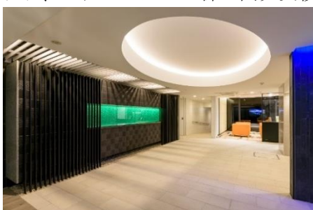
時間帯で色が変わるエントランスの壁面 (ベルファース西五反田)

当社では1996年より都内を中心に都市型賃貸マンションを開発し、賃貸マンションのブランドとして「ベルファース」を展開しています。都心に勤務するビジネスパーソンや単身赴任者にも納得のグレード感や快適性、きめ細やかな機能性を備えた住まいをご提供しており、これまでに187棟の開発実績があります。