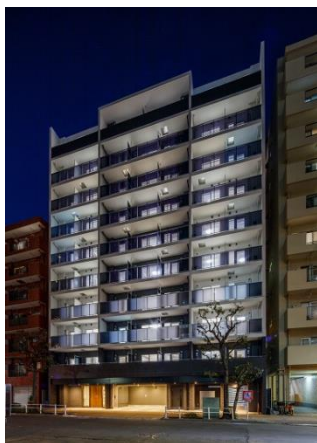
ベルファース大森

オリックス不動産株式会社（本社：東京都港区、社長：深谷 敏成）は、オリジナルブランドの賃貸マンション「ベルファース大森」（東京都大田区、全60戸）がこのたび竣工し、2月中旬より入居を開始しますのでお知らせします。