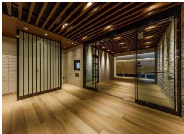
エントランスホール

「ベルファース大森」は、JR京浜東北線「大森」駅より徒歩5分、京急本線「大森海岸」駅から徒歩9分と、2駅2路線の利用が可能です。東京駅や品川駅をはじめとする都心主要駅へ乗り換えなしで移動でき、かつ、羽田空港へも30分圏内と交通利便性の高いロケーションです。本物件から徒歩5分圏内には、食料品スーパーなどが揃う商業施設や衣料小売店などが充実しており、生活しやすい環境が整っています。60戸全てが南向きで、明るく機能的な住空間を構築しています。さらに、エントランスホールは、住む人を優しく包み込むよう、木目調の落ち着いた空間を表現しました。