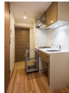
移動式キッチン収納 (ベルファース門前仲町Ⅱ)