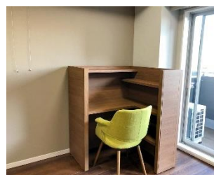
(上) 玄関に設置した壁フック (下) ワークブースを設置