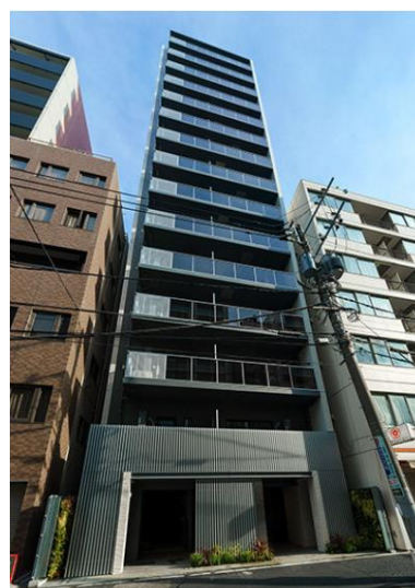
ライオンズフォーシア秋葉原イースト 外観