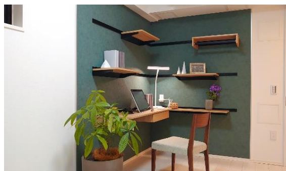
ライオンズフォーシア秋葉原イースト (壁面レール収納)

株式会社大京（本社：東京都渋谷区、社長：深谷 敏成）は、壁面レール収納や壁面デスクなどテレワーク機能付きの間取りを導入した新築賃貸マンション「ライオンズフォーシア秋葉原イースト」および「ライオンズフォーシア築地ステーション」において、2021年1月下旬より入居を開始しますのでお知らせします。