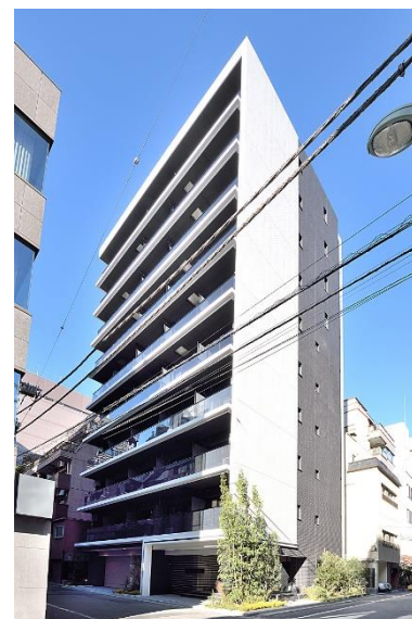
ライオンズフォーシア築地ステーション 外観