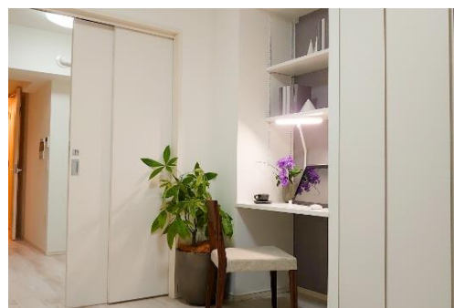
ライオンズフォーシア築地ステーション (壁面デスク)

在宅勤務の実施など働き方の多様化の進行に伴い、自宅に快適なワークスペースを確保するニーズが高まっています。本賃貸マンションの主要タイプ（1DK と 1LDK）を対象に本プランを導入しました。