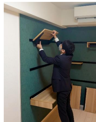
壁面レール収納 （取り外しイメージ）

壁面レール収納は、壁面に設置したレールに、カウンターデスク、棚板、ハンガー棚を自由に組み合わせてワークスペースを作ることができます。カウンターデスクと棚板を組み合わせてL型デスクとして使用するほか、アフターコロナを見据えてハンガー棚も用意しており、ワークスペースだけでなく柔軟性の高い収納としても活用いただけます。