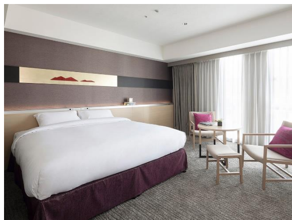
高層階のデラックスルームを確約（イメージ）

本プランには、日本のみならず世界で高い評価を受けているヴィンテージジャパニーズウイスキーの中でも特に入手が困難とされる「山崎25年」（2部屋）、「白州25年」（1部屋）、「響30年」（2部屋）のウイスキー1本が含まれ、5室限定でご用意します。