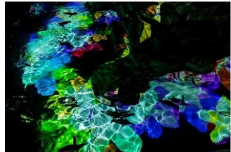
プロジェクションマッピングの中を ペンギンたちが泳ぐようす

開催内容：12月限定で実施する日本最大級の屋内開放型ペンギンプールの底面に、音楽に合わせてキャンディカラーの映像を投影する約8分間のショープログラムです。イルミネーションのようにカラフルな光がペンギンプールを満たします。ペンギンと一緒にクリスマスイルミネーションを楽しむようにご覧ください。