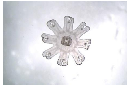
星のようなミズクラゲの赤ちゃん“エフィラ”