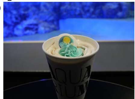
タピオカ入り「月とクラゲココア」

商品詳細：「月とクラゲ」をイメージした冬季限定のホットココアを発売します。クラゲの食感をイメージしたタピオカが入ったホットココアの上に、夜空のように青いミント味のホイップクリームと、月がプリントされたマシュマロを浮かべました。寒い冬にぴったりのドリンクです。