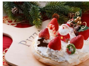
「クリスマスドルチェピッツァ」

大阪のブランド豚を使ったミートソースを生地にのせ焼き上げ、生ハムやブルサンチーズ、数種の野菜など“太陽の恵み”たっぷりに仕上げたピッツァです。