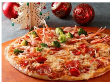
「ウインターピッツァ」

■クリスマス期間：2020年11月9日（月）～12月23日（水）※写真はイメージです。