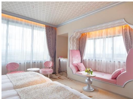
きらきらコーナールーム (イメージ)