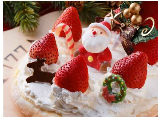
クリスマスシーズンのピッツア （イメージ）

本プランは、午後12時30分から午後7時までの客室でのご滞在と、館内レストランの石窯で焼く出来立てピッツアのデリバリーが付いた日帰りプランです。ピッツアは、ハロウィン期間とクリスマス期間でメニューが変わります。大阪のブランド豚を用いたミートソースを使った「太陽の恵みピッツア」、各イベントをイメージした季節限定のピッツア、蟹など旬の食材を使用したピッツアなど各3種をご用意し、お1人さま1つずつお選びいただけます。イベントの多くなる季節にあわせて、仮装*をしてお祝い、お誕生日などの記念日のお祝い、周りを気にせずのんびり女子会など、ホテルでの“非日常”空間でゆっくりお過ごしいただけます。