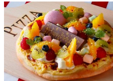
「パースデードルチェピッツァ」

大阪のブランド豚を使ったミートソースを生地にのせ焼き上げ、生ハムやブルサンチーズ、数種の野菜など“太陽の恵み”たっぷりに仕上げたピッツァです。