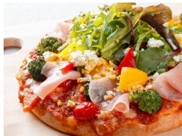
「太陽の恵みピッツァ」

トマトソースの上には、にっこり笑顔のモzzarellaおぼけがずらり。石窯で焼かれてビニョーンとトロけた姿がとってもキュート！ブラックオリーブの蜘蛛たちと一緒に Happy Halloween！