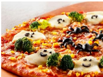
「ハロウィーンピッツァ」

■ハロウィーン期間：2020年10月9日（金）～11月8日（日）※写真はイメージです。