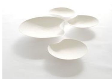
繊細なタッチで土に波を造る