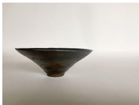
テーマ「造波 - zouha」より

本イベントは、クロスホテル大阪では初めて、アート展示を通して大阪・なんばの文化や歴史などに触れていただくことを目的に開催するものです。今回は、ホテルの全面リニューアルを受け、古いものが時間を経て、新しく姿を変えて受け継がれていくことをイメージした『The Flow of Time～時の流れ』をコンセプトに、大阪を拠点に活動する二名の作家がそれぞれのテーマで制作した28作品を展示します。