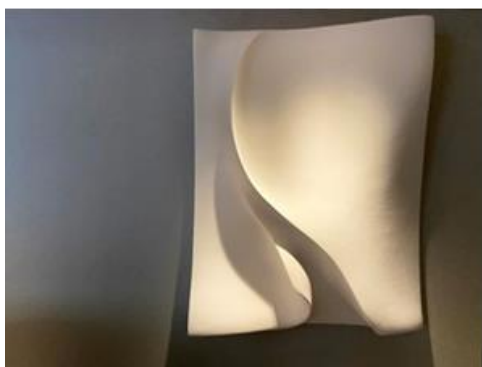
テーマ「瞬 - timing」より 作品名【砂丘】