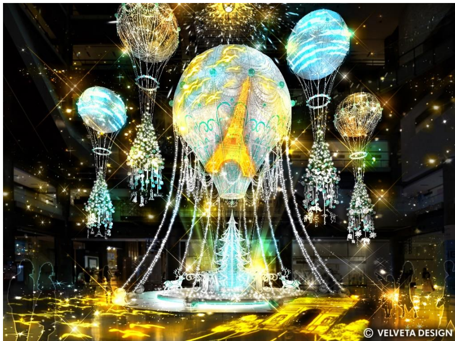
ライティングショー実施イメージ

大陸を巡り旅する気球たちは希望の光を運び、世界中の空をひとつに繋いでいく。この冬、願いを届ける幻想的なクリスマスツリー『Winter Voyage Tree』がナレッジプラザに登場します。それぞれの気球に彩られたオーナメントは、一つ一つ個性あふれる世界各地の建造物や植物、動物たちをモチーフに表現し、期間中は世界各国を旅するイメージを光で表現した「ライティングショー」も開催します。