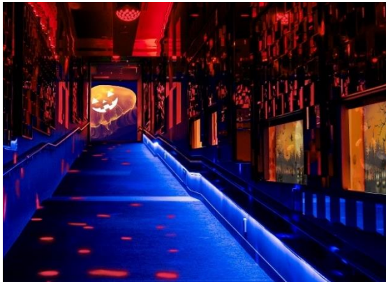
「クラゲとハロウィン」昼の照明 (イメージ)