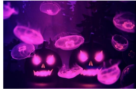
万華鏡トンネル内のミズクラゲ水槽