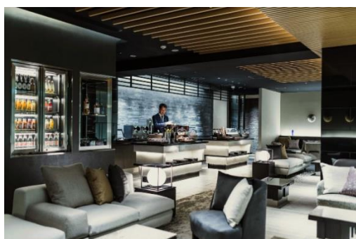
ゲストラウンジ 間 (AWAI)