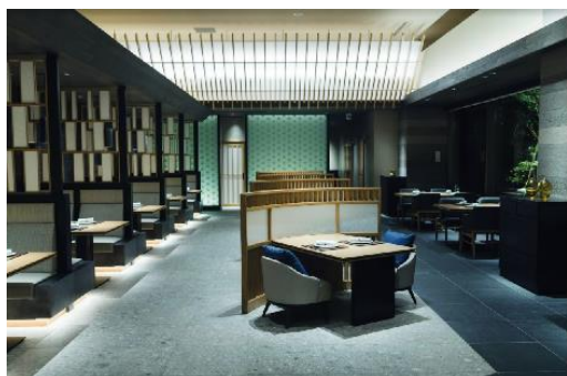
メインダイニング「六つ喜」

「六つ喜（むつき）」では、全国から厳選した旬の食材を使用した、会席料理をベースにした和食をお楽しみいただけます。夕食は、月わりの季節の前菜からはじまり、パティシエがつくる美しい水菓子など全8品で構成されます。メインは魚料理と肉料理、合わせて6種類の中から2品を選べるプリフィックススタイルでご提供します。朝食は、土鍋でふっくらと炊き上げた白米と、料理長がこだわり造りあげたごはんのお供をお召し上がりいただけます。