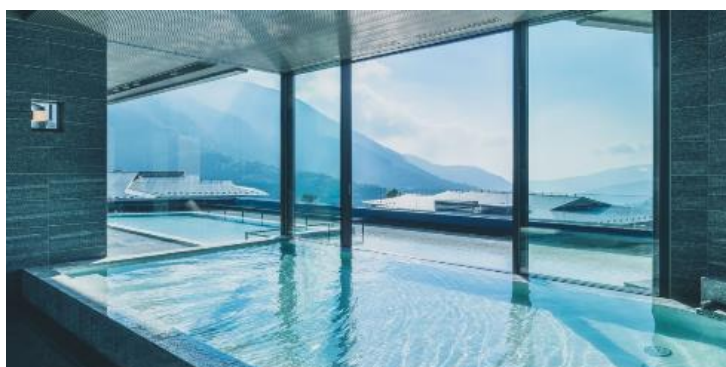
展望露天風呂「蒼海」

URL： https://www.youtube.com/watch?v=4nKAfid8eaI