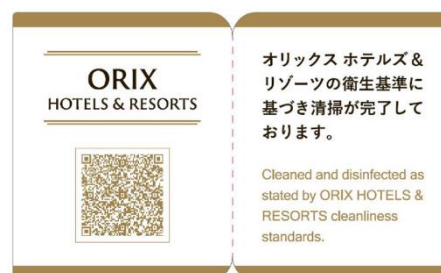
クリーンステイ・ルームシール（イメージ）

すべてのお客さまに、安心・安全にご利用いただけるよう、オリックス不動産株式会社とオリックス・ホテルマネジメント株式会社では、クレンリネスポリシー（『With COVID-19』下における運営・サービス指針）を策定し実践しています。