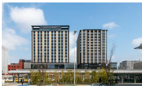
「クロスゲート金沢」外観写真（昼）

当施設全体で「LEED ND（近隣開発）」、施設の中核である2ホテルで「LEED NC（現LEED BD+C、建築設計および建設）」のシルバー認証 ※1 を得ました。なお、フルサービスホテルでLEED認証を取得するのは日本初となります。