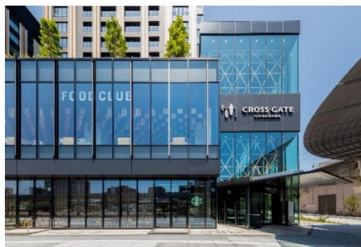
商業部分エントランス