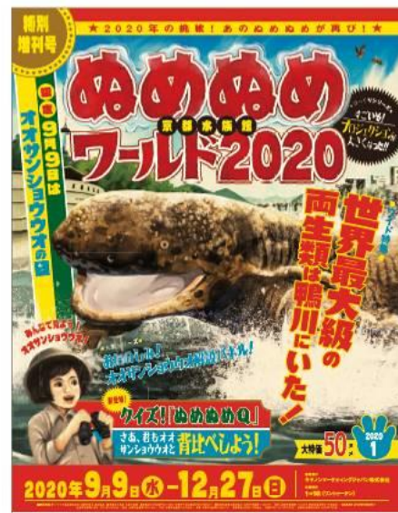
イベントポスター（イメージ）

そのほか、少しマニアックな質問も出題される、大型モニターでの映像を交えたクイズ『キミは答えられるか！クイズ！「ぬめぬめQ」』や、昨年SNSで話題となったオオサンショウウオのマシュマロを浮かべたドリンクメニューや新グッズも登場します。