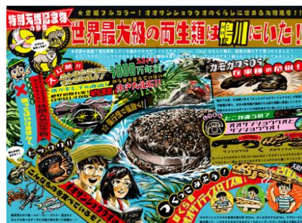
怪獣劇画風「オオサンショウウオ解説パネル」 (イメージ)

オオサンショウウオが約3,000万年前から生息しているという背景から、まるでタイムスリップしたかのように、ワクワクしながら読んでいただける解説パネルを制作しました。鴨川で起きている在来種と交雑種の関係性や、雑食性のオオサンショウウオが自然界では何を食べているのかなど、迫力のあるイラストと色彩を用いて表現しています。昭和時代の漫画雑誌をイメージした怪獣劇画風デザインは、読み手の探求心をくすぐります。