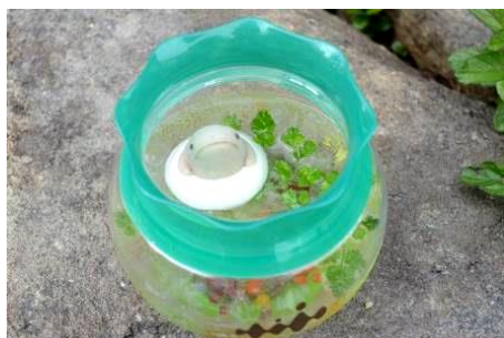
オオサンショウウオ鴨川ソーダ(イメージ)

昨年のオオサンショウウオイベントで販売したドリンクメニューが、今年も復活します。公式 SNS では、「水面にちょこんと顔を出したオオサンショウウオの姿がかわいい」と話題になり、連日完売が続いた人気メニューです。カラフルな食べられる海藻ビーズが入ったアップルソーダに、オオサンショウウオのマシュマロを浮かべたインパクトあるドリンクは、お持ち帰り可能な、京都水族館ロゴ入りの金魚鉢型スーベニアカップで提供します。