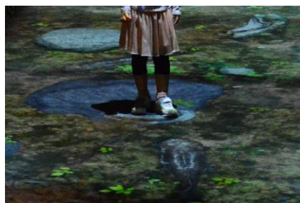
デジタル映像技術で演出された空間(イメージ)