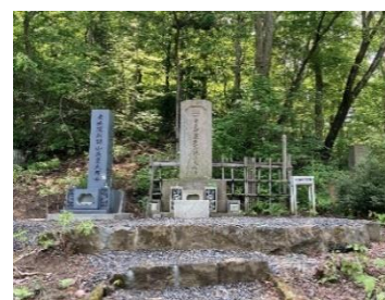
新選組局長 近藤勇のお墓