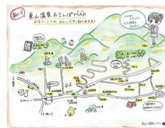
当館オリジナル制作「散策マップ」