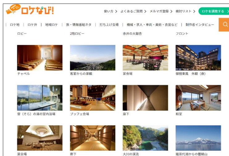
「ロケなび!」サイト掲載ページ (イメージ)