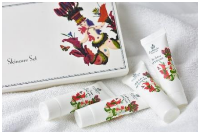
「カルトウージア」スキンケアセット

※その他、対象客室にはクレンジング、フェイスソープ、ジェルアイマスク、入浴剤などのアメニティを常時ご用意しています。