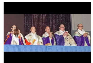
声明ライブイメージ

仏教の聖歌ともいわれる声明を、7名の高野山僧侶によるライブでお届けします。1200年の時を超えて、唱え続けられる仏教声楽「南山進流声明」。今回は、寺院の中に閉じ込められてしまった、心揺さぶる僧侶の歌の「OMOSIROI」に迫ります。聞く者の心を洗う声明ライブを、ご体感ください。