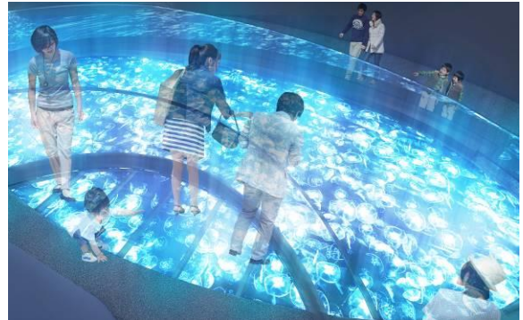
張り出すガラス床（イメージ）

現在クラゲを展示している「アクアラボ」、水槽が絵画のように並んだ「アクアギャラリー」を全面改修します。約2倍の広さに拡張する新しい「クラゲエリア」には、長径7メートル、短径3メートルの水盤型水槽を新設します。ふわふわと漂う約500匹のミズクラゲを、上から直に観察できます。水盤の一部には、水面に張り出すガラスの床のデッキを設置し、足元をクラゲが横切り、まるで水面に立っているような浮遊感を感じます。