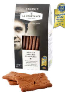
オーガニックスペキュロス