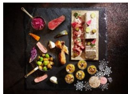
クリスマスbuffet イメージ (NOKA Roast & Grill)