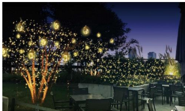
南館9階 屋外植栽エリア 実施イメージ