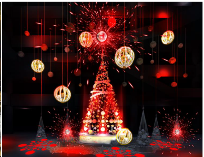
『Brilliant Tree』(ライティングショー時)

グランフロント大阪（大阪市北区大深町）は、訪れる人々の心を、そして大阪を光り輝かせるクリスマス『GRAND WISH CHRISTMAS 2019』を11月7日(木)から12月25日(水)まで開催します。