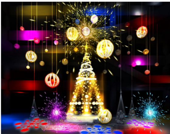
『Brilliant Tree』(ライティングショー時)

※ 2019年冬デビューのコラボレーションライン最初のコレクション。パールやジュエリーにインスパイアされた、ゴールドを基調とした華やかなデザインが特徴。