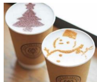
スノーマンフード イメージ (北館1階 OVER THE CENTURY)