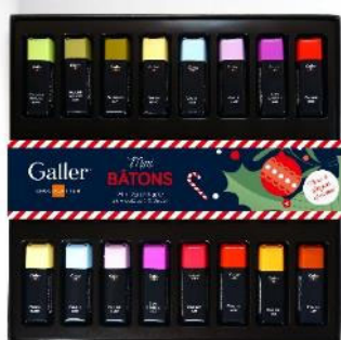
ガレーチョコレート