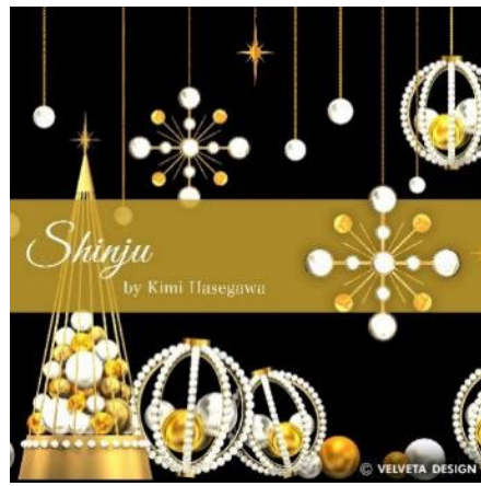
『Kimi Collection “Shinju-真珠”』

<実施期間> 2019年11月7日(木)～12月25日(水) ※ライティングショー: 17:00～24:00