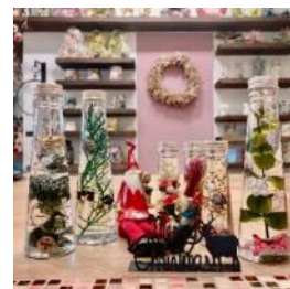
ワークショップ イメージ

※期間内のレシート合算可。実施場所にてレシートをご提示ください。「SOCIO(ソシオ)」によるクリスマスにちなんだワークショップは無料。