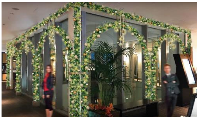
南館8階 エスカレーター横・吹き抜けエリア 実施イメージ