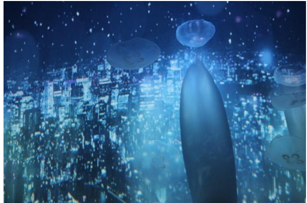
都会の雪景色の背景とミズクラゲ