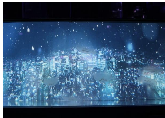
クラゲ水槽の背面に雪景色の映像

すみだ水族館（所在地：東京都墨田区、館長：名倉 寿一）は、2019年11月16日（土）～2020年2月27日（木）の期間、都会の雪景色とクラゲの世界観を体感できるインタラクティブアート「雪とクラゲ」を開催しますのでお知らせします。