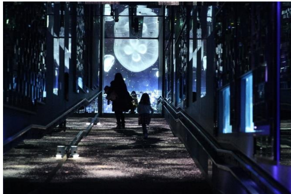
「雪とクラゲ」前回のようす