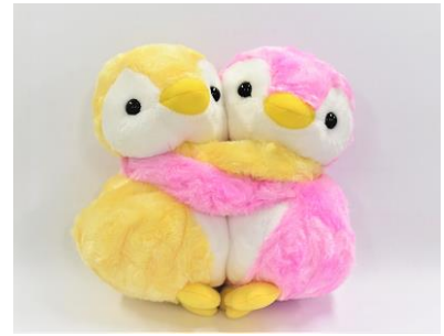
かまんざとさやのラブラブぬいぐるみ