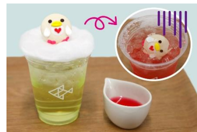
マカロン vs なでしこドリンク ～ライムをめぐる～

販売内容：爽やかなライムジュースの上にペンギンマカロンがのったドリンクです。「ライムをめぐるなでしこから攻撃を受けたマカロン」というペンギンのエピソードを表現しています。「なでしこ」をイメージしたいちご味のソースをかけると、マカロンが沈んでいきます。