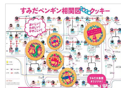
すみだペンギン関連図クッキー (パッケージイメージ)