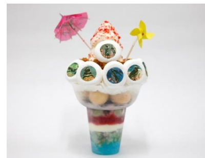
下町ペンギン大家族パフェ

販売内容：すみだ水族館生まれの大家族「まつり」「はなび」「はっぴ」「たいこ」「わっしょい」と、その両親である「カリン」「カクテル」の一家を全高約23cm・重さ約500gのファミリーサイズのパフェで表現しました。