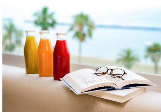
ジュースクレンズ&読書イメージ (ミクラス、はなをり)

オリックス不動産株式会社（本社：東京都港区、社長：高橋 豊典）は、運営する「函館・湯の川温泉 ホテル万惣」「ホテルミクラス」「箱根・芦ノ湖 はなをり」の3施設で、秋の夜長を楽しむ連動企画『本と過ごす心とカラダのデトックス旅』を、2019年10月1日（火）より開催しますのでお知らせします。