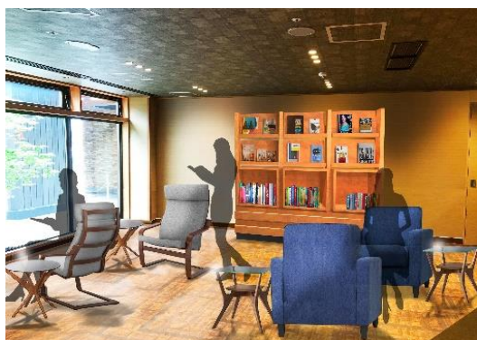
ライブラリーイメージ (ホテル万惣)