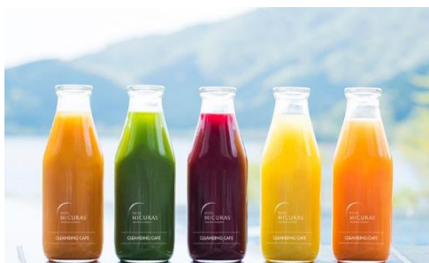
コールドプレスジュース イメージ