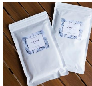
「デトックス粥」「クレンジング粥」