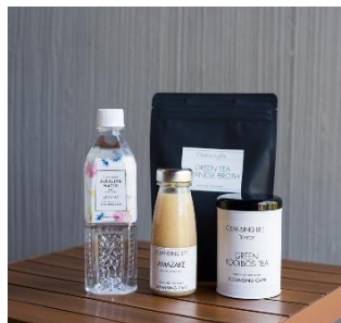
アルカリイオン水、甘酒、ルイボスティー、ブロス（出汁）