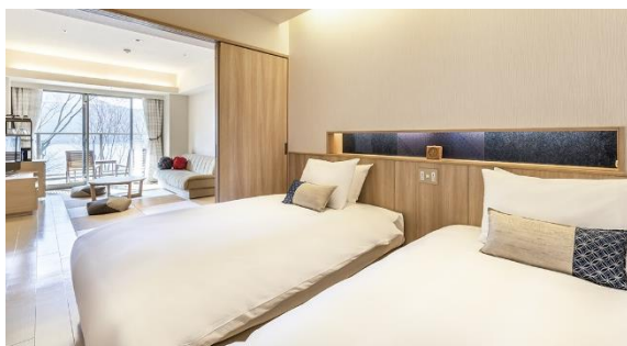
和洋室デラックスタイプ（箱根・芦ノ湖 はなをり）