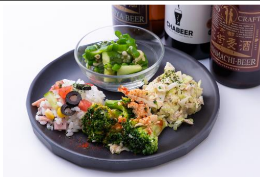
デリはお好きなだけお楽しみいただけます

おくらときゅうりのねばねば和え、キャベツとツナのサラダポテチ添え、ジャガイモの西京味噌マヨ、揚げ茄子の煮浸し、ブロッコリーと蒸し鶏のオイルガーリック炒め、インサラータリーゾ（イタリア風お米のサラダ）