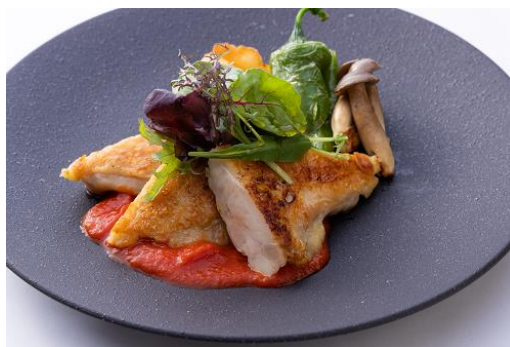
チキングリルトマトソース