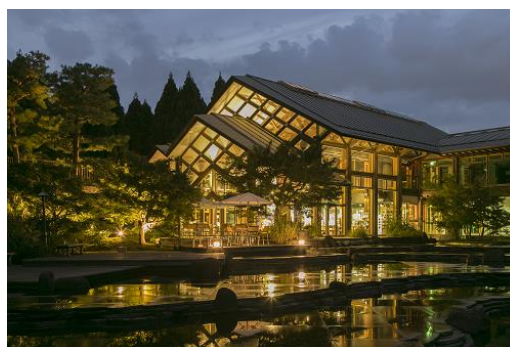
ライトアップされた夜の「緑の館」