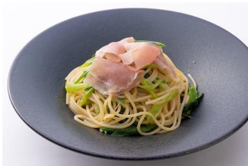
生ハムと九条ネギのペペロンチーノ