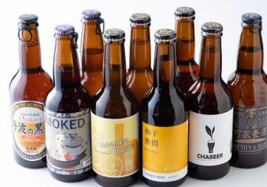
各種クラフトビール