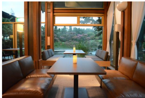
ゆったりとくつろげるソファ席

シックな色合いの木目調のダイニングテーブルをはじめ、ナチュラルで落ち着いた雰囲気のインテリアで統一しました。また、室内のダイニングエリアと屋外テラスにソファ席を新たに設けました。朝食、ランチ、カフェ、ディナー、バーと、それぞれのご利用シーンで、ゆったりとくつろぎながらお食事をお楽しみいただけます。