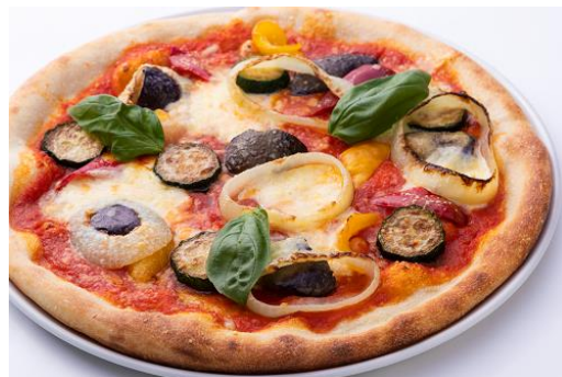
京野菜ごろごろピザ