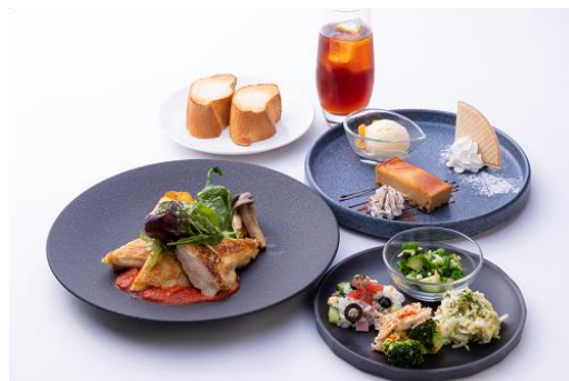
スペシャルセット