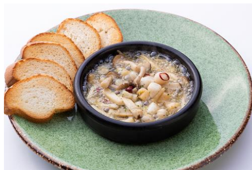
きのこと小柱のアヒージョ