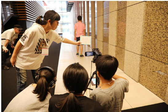
「うめきたフィルム学校」の様子