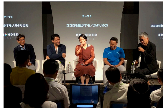
「BRANDED SHORTS 2018」の様子