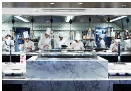
活気のあるオープンキッチン

オールデイダイニングとして、各時間帯で異なるメニューをライブ感溢れるオープンキッチンからお届けします。ビュッフェスタイルの朝食、本格フレンチのメインディッシュを選べるランチ、カジュアルにフレンチを楽しめるブラッセリー、モダンフレンチのコースを堪能できるディナーを展開します。