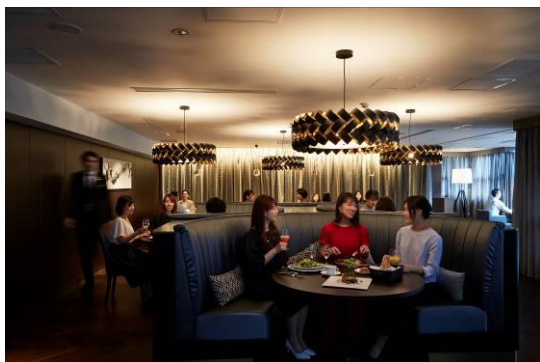
落ち着いた雰囲気のある DINING-C