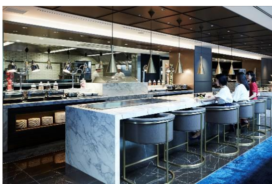
オープンキッチンのある DINING-A

6つのゾーンに分かれた183席のレストランです。オープンキッチンで活気あるメインダイニングをはじめとする3つのダイニングに加え、待ち合わせにも最適なバー、高級感のあるプライベートダイニング（個室）、開放的なオープンテラスがあり、すべて異なるテーマでデザインされた空間です。カジュアルからフォーマルまで、さまざまな利用シーンに対応します。