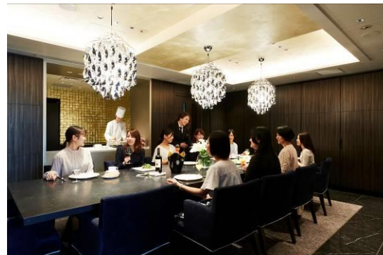
高級感のある PRIVATE DINING