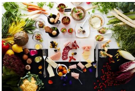
ランチビュッフェ（イメージ）

初夏の日差しをたっぷり浴びた夏野菜を使い、南仏プロヴァンス地方のテイストを取り入れた料理をご提供します。メイン料理はプリフィクススタイルで本格フレンチの一皿をお選びいただけます。バリエーション豊かな前菜や25種を超えるデザートはビュッフェスタイルでお楽しみいただけます。