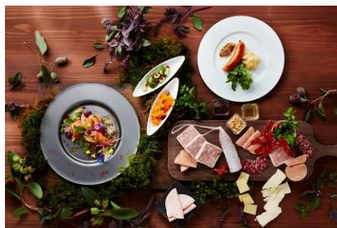
ブラッセリーメニュー（イメージ）

キャロットラペときゅうりのプロヴァンス地方風、フランス産鴨のモモ肉のコンフィ、南仏風“海の幸トマト風味”、南仏風ズッキーニとゴートチーズのグラタン、フランス産エスカルゴのフリカッセマデラ風味、フランス産チーズ、フランス産生ハム プロシュートなど