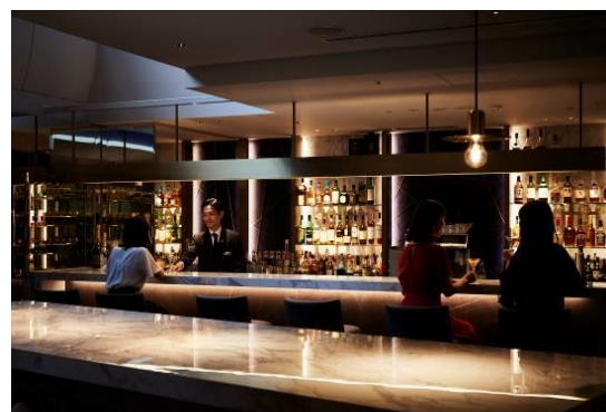
待ち合わせにも最適な BAR