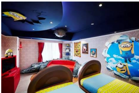
Minions Room ～グルーの邸宅～