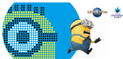
ドットミニオンが現れ、逃げ回るミニオンたち