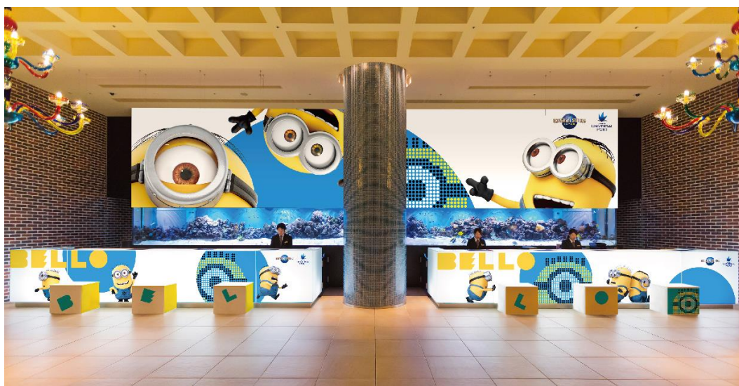
ミニオン・ビッグ・ベロー・デコレーション！（イメージ）

ユニバーサル・スタジオ・ジャパン オフィシャルホテル『ホテル ユニバーサル ポート』（所在地：大阪府大阪市此花区、総支配人：金井 紀生）は、2019年7月15日（祝・月）より、パークの人気者「ミニオン」をモチーフとしたロビー装飾「ミニオン・ビッグ・ベロー・デコレーション！」を開始しますのでお知らせします。