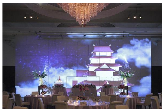
3D プロジェクションマッピング「会津の四季」

3D プロジェクションマッピングは、結婚式での上映を中心に、縦6メートル、横12メートルの大壁面を使った迫力ある映像演出で、披露宴などを盛り上げています。このたび、夏の特別プログラムとして、会津の魅力が詰まった「会津の四季」「デジタルトラベル」を新たに制作し上映します。