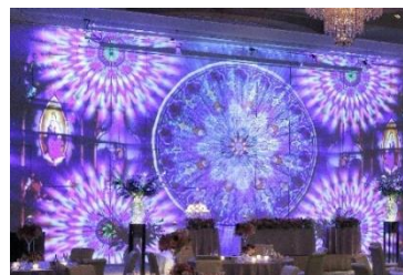
上映イメージ（過去の作品）

【内 容】バンケットホール「鳳翔」の大壁面にて3D プロジェクションマッピング「会津の四季」と「デジタルトラベル」を上映します。磐梯山と猪苗代湖に鶴ヶ城、桜や花火など色鮮やかな映像が会場いっぱいに広がり、美しい会津の四季や名所をダイナミックに表現しています。会津の夏の夜に、迫力のある音楽と映像演出をお楽しみいただけます。