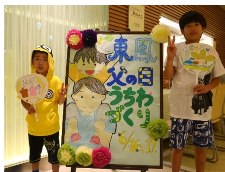
※2018年の父の日イベントでの記念撮影

【内 容】 カラフルな色合いのマスキングテープやシールなどを使い装飾し、手作りうちわやメッセージカードを作ります。普段伝えられないお父さんへの感謝のメッセージ、ご家族での思い出作りなど、お気軽にお立ち寄りください。