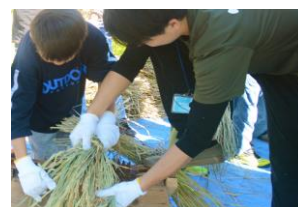
自分で脱穀・精米してみよう

昔ながらの機械である千歯こきや唐箕（とうみ）を使い、稲をもみ殻・玄米・ちりなどに選別します。力や手間のかかる作業で、食べ物作りの大変さを実感しながら、苗が白米になるまでのおよそ4か月にわたる経過を実感することができます。