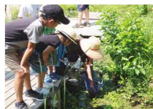
魚や昆虫などのいきものたちを見つけよう

夏の日差しを浴びてぐんぐんと育つ青々とした稲のまわりや、「京の里山」を流れる川や池の中をじっくりと観察し、里山を中心とした自然環境の中でのようないきものが暮らしているのかを学びます。