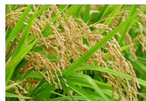
ぎっしりと実った稲をいよいよ収穫

頭を垂れるほどたわわに実った稲の根元から鎌を使って刈り取っていきます。刈った稲の束を持ち運ぶ際の重さなども感じながら、「はざ掛け」と呼ばれる乾燥作業までを体験します。