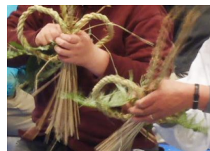
収穫後の稲も大切に使う昔の慣習を体験

収穫した稲わらを使い、新年が良い年になるよう祈りを込めて「しめ縄」を作ります。「しめ縄」は家内安全・厄除けのご利益があるとされており、正月に家に飾る風習があります。