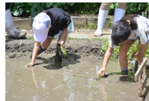
泥の感触はどんな感じ？

水を張った田んぼに入り、泥の感触や冷たさを感じながら、稲の苗を一株ずつ植えていきます。スタッフから苗の間隔や植える深さなどのコツを聞き、これからお米が育つようすをイメージして田植えを行います。