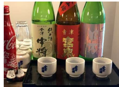
利き酒のイメージ