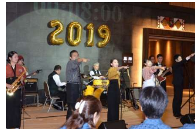
2019年ニューイヤーライブのようす