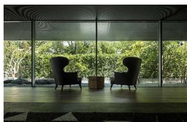
クロスホテル京都